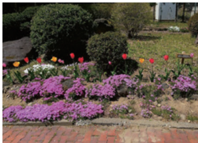
子どもたちが、お隣の上田市公文書館の庭に植えたチューリップ(令和3年4月)

地域の方々にいろいろと助けていただいた東内保育園でした。本当にありがとうございました。