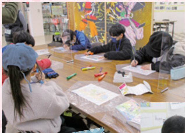
ひびきあい教室 凧作り