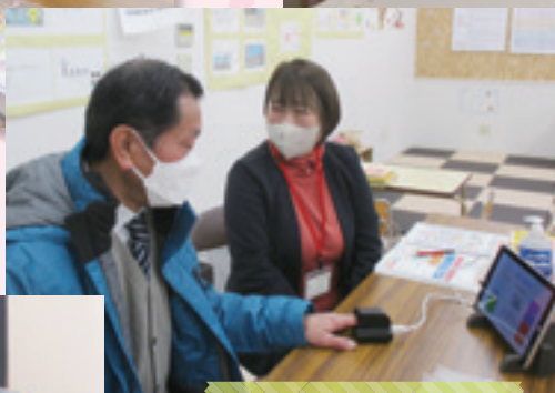
血管年齢測定イベント