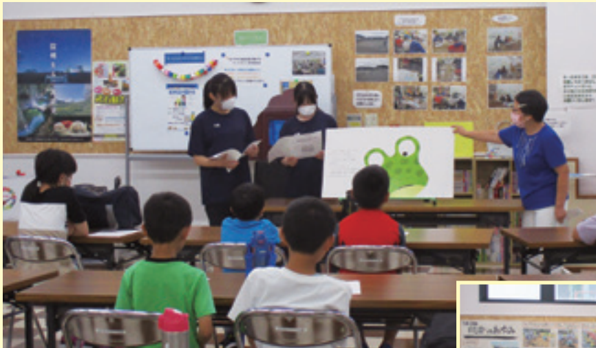
高校生による読み聞かせ

あつたるこ夏休みイベントとして、絵本の読み聞かせを2回行いました。 当日は、地域で活躍している方々や丸子修学館高校の生徒さんに、大型絵本や紙しばいの読み聞かせをしていただきました。合間にウクレレの演奏があり、大勢の子どもたちが楽しい時間を過ごしました。