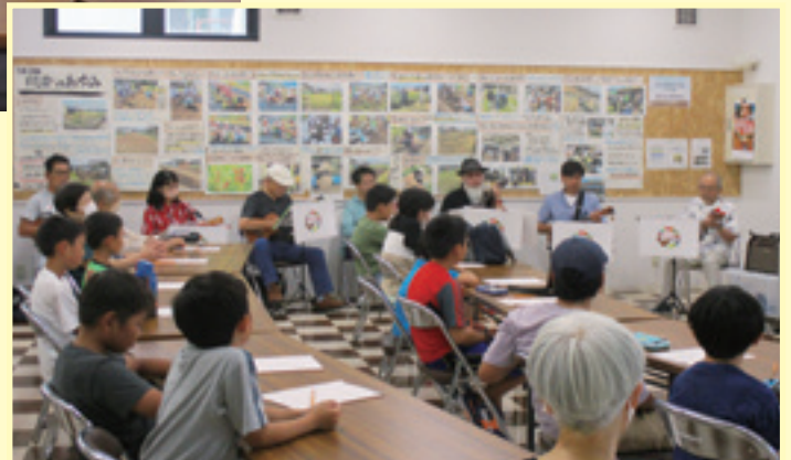
ウクレレアンサンブル「ホアロハ」による演奏