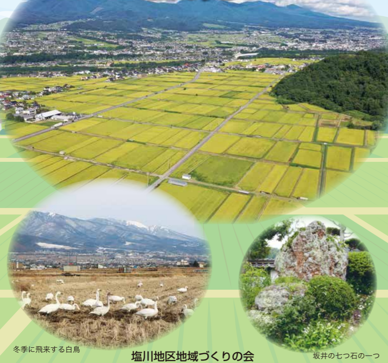
冬季に飛来する白鳥 塩川地区地域づくりの会 坂井の七つ石の一つ

塩川地区には約4,000人が暮らしています。 千曲川沿岸：石井・郷仕川原 美田が広がる段丘上：坂井・狐塚・南方 景色抜群の高原：藤原田 からなります。