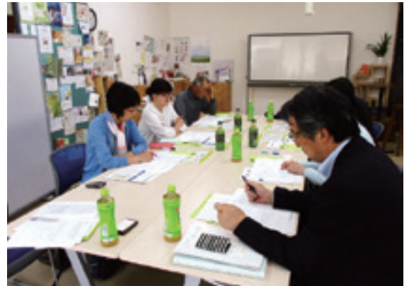
「とうみレッツ号」視察研修の様子

9月26日 地域協議会が要請した出前講座にまちづくり会議交通部会も参加しました。まりんこ号を含む上田市の交通事業についてレクチャーをうけました。